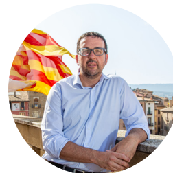
Albert Castells Vilalta Alcalde de Vic