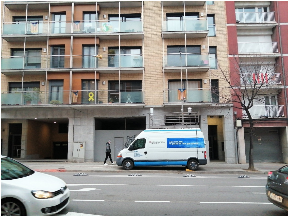
Figura 1: Imatge de la ubicació exacta de la UM3 a la Ronda de Francesc de Camprodon.